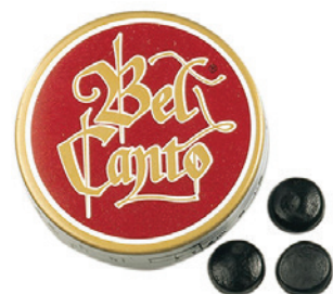
BEL CANTO 24X20 JOR3692 34.16€