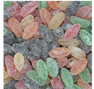
GOMMES PECTORALES ASSORTIES JOR3680 20.03€