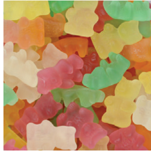
OURSONS (SANS SUCRE) JOR3664 17.48€