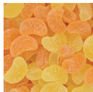
QUARTIERS JOR3666 10.58€