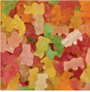
OURSONS JOR3660 10.58€