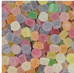
MÉLI-MÉLO JOR3658 10.58€