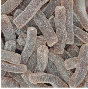
BÂTONS COLA JOR3678 10.58€