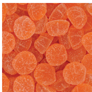
MANDARINES JOR3657 10.58€