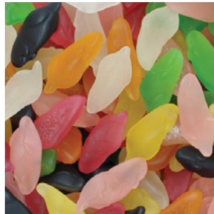
SOURIS (SANS SUCRE) JOR3675 17.48€