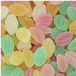
TORSADES JOR3679 10.58€