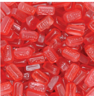
RHUM DROPS JOR3656 20.03€