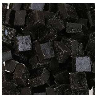
JUJUBE COUPÉE JOR3694 23.98€