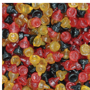
TOUPIÉS JOR3669 20.03€