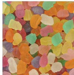
CONFETTIS (SANS SUCRE) JOR3681 17.48€