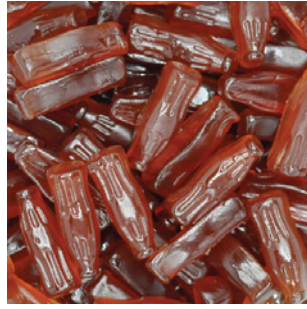
BOUTEILLES COLA JOR3655 20.03€