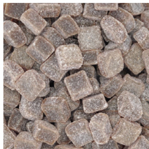
GINGEMBRE JOR3673 18.23€