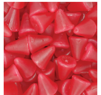
CUBERDONS JOR3684 10.58€