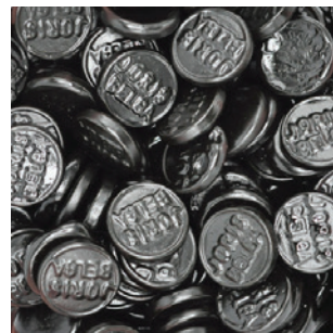
BELGAS JOR3687 20.03€