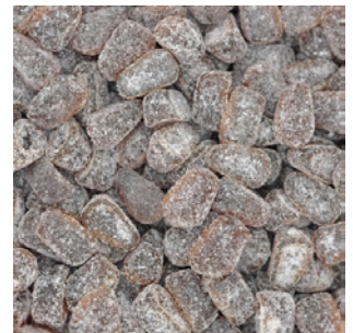
PECTOR BRUN JOR3683 20.03€