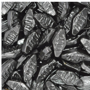
ZOUT JOR3685 20.03€