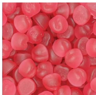
CERISES (SANS SUCRE) JOR3667 17.48€