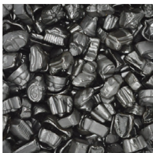
JUS PETIT JOR3688 20.03€