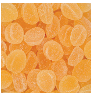
ABRICOTS JOR3665 10.58€