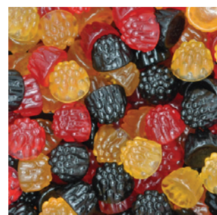
BOULES ASSORTIES JOR3671 20.03€

Prix HTVA pour vos achats du 01/04/2024 jusqu'à la livraison ou jusqu'à épuisement du stock. Photos non contractuelles. Promotions non cumulables. Prix susceptibles de subir des modifications en cas d'augmentation des tarifs de nos fournisseurs.