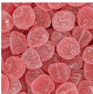
CERISES TENDRES JOR3668 10.58€