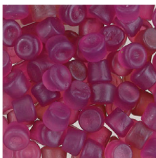
AGENTS MAUVES JOR3693 20.03€