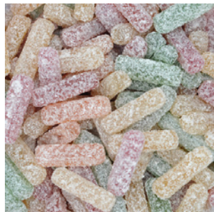
CITROS JOR3654 20.03€