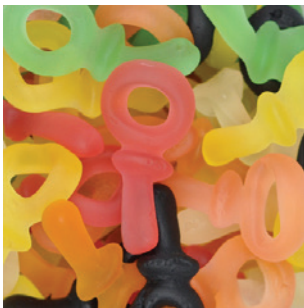
TÉTINES JOR3682 10.58€