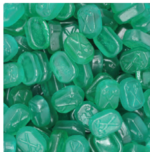
BRIQUETTES VERTES JOR3677 20.03€