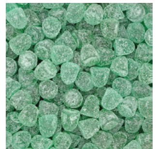
GOMMES VERTES JOR3922 20.03€