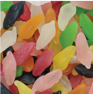
SOURIS JOR3862 10.58€