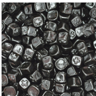
MENTHOL + JOR3689 20.03€