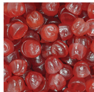
CERISES LAVÉES JOR4046 20.03€