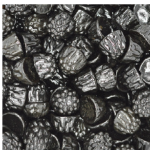
BOULES PICOTÉES JOR3691 20.03€