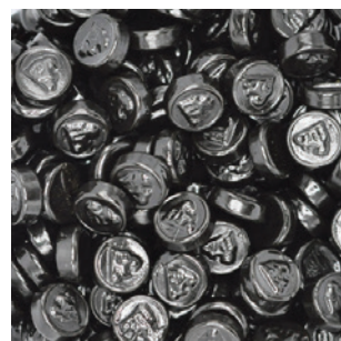
CENT / COIN JOR3690 20.03€