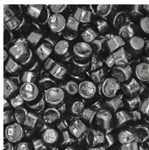
AGENTS DE CHANGE JOR4047 20.03€

Prix HTVA pour vos achats du 01/04/2024 jusqu'à la livraison ou jusqu'à épuisement du stock. Photos non contractuelles. Promotions non cumulables. Prix susceptibles de subir des modifications en cas d'augmentation des tarifs de nos fournisseurs.