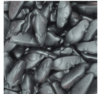
SOURIS NOIRES JOR3676 10.58€