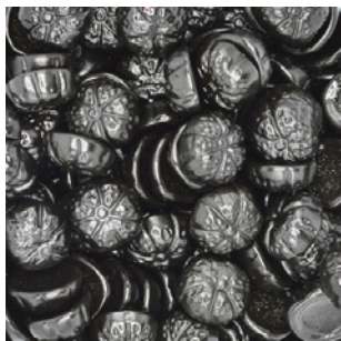
OURSIN SALMIAK JOR3686 21.38€