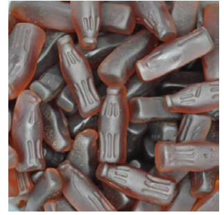
BOUTEILLES COLA (SANS SUCRE) JOR3906 17.48€