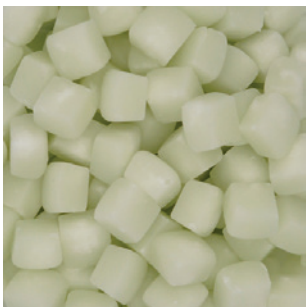
CARRÉS DE MENTHE JOR3659 10.58€