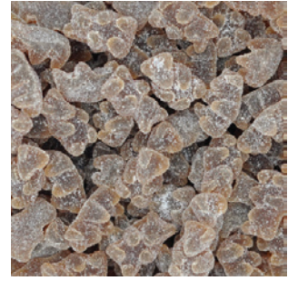
OURSONS COLA JOR3674 10.58€